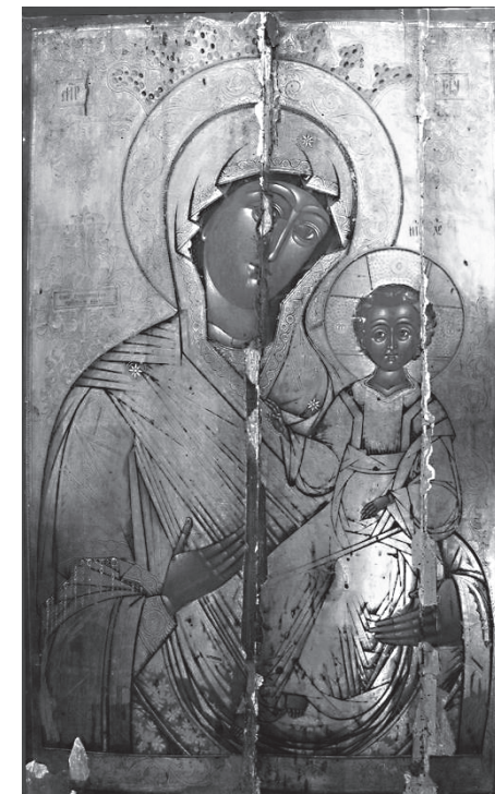
Fig. 4. Tătăraștii de Sus. Biserica „Sfântul Nicolae” – icoană împărătească „Maica Domnului cu Pruncul”.

Naosul corespunde unui plan dreptunghiular despărțit de altar prin tâmpla de zidărie cu deschiderile ușilor încheiate cu arcuri în formă de acoladă și cu pereții de nord și sud prevăzuți cu câte două ferestre. Accesul din naos în pronaos se realiza