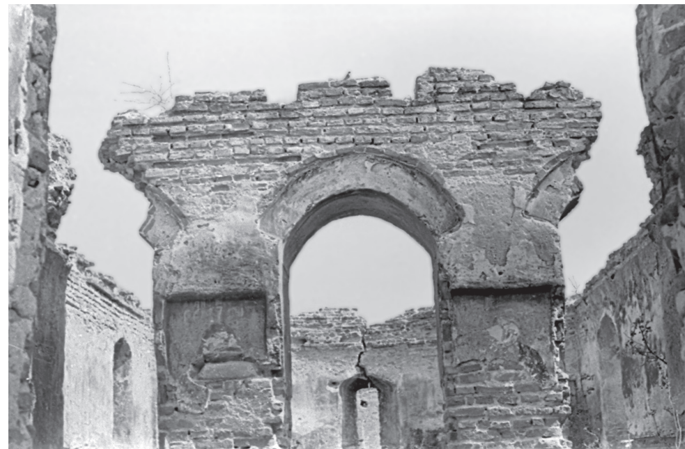
Fig. 2. Tătărăștii de Sus. Ruinele Curții Bălăceanu – biserica.

ale căror focuri se încrucișează exact în centrul porții, în plus o grindă puternică aluneca în spatele ușilor grele de lemn, baricadându-le 14 .