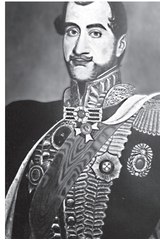
Fig. 1. Pictură de epocă a domnitorului Alexandru al II-lea Dimitrie Ghica (1834-1842).