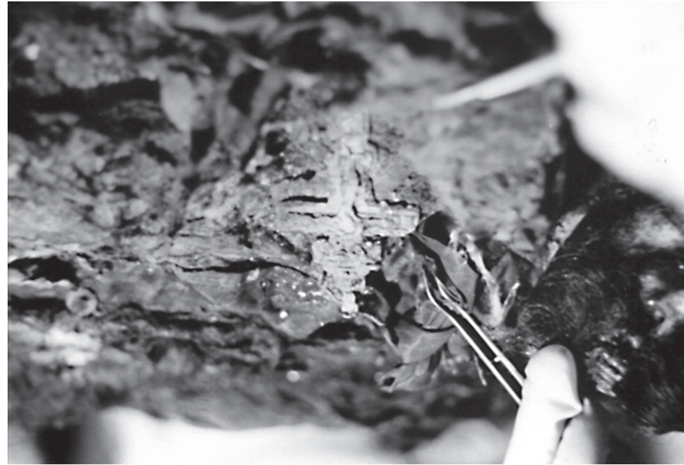
Fig. 4. Imagine asupra crucii pectorale de aur, descoperită cu prilejul cercetărilor antropologice efectuate în naosul bisericii rotunde de la Palatul Ghica-Tei (1985)

pentru Patrimoniul Cultural-Național 13 , ceea ce se mai putea salva din obiectele de patrimoniu aflate în biserică, până în zorii zilei; operațiunea trebuia făcută repede și fără tulburare. Am fost martorii acelei nopți pline de coșmar și dramatism, când soluții pentru salvarea și recuperarea mormintelor domnești se profilau a fi greu de găsit. Subliniem că obiectivele conservării, în concepția și indicațiile oficiale, erau legate mai mult de materialul litic, ancadramente de la uși și ferestre, pisanii, alte bunuri considerate de patrimoniu. Condamnarea la dispariție a Bisericii Mănăstirii Pantelimon, aflată pe lista monumentelor istorice la acea dată, nu reprezenta un motiv suficient pentru a nu întreprinde tot ceea ce era posibil pentru recuperarea rămășițelor pământești ale voievozilor. S-a degajat mai întâi piatra funerară a ctitorului și osemintele profanate ale acestuia, Grigore al II-lea Ghica și ale doamnei Zoe. Mormântul B 14 , aflat în partea stângă