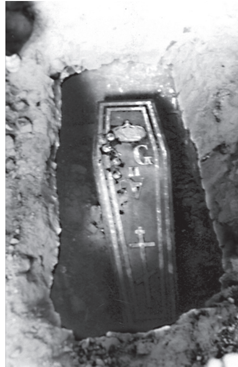
Fig. 2. Primul sicriu din metal (zinc), aflat in situ pe peretele de nord al Bisericii Mănăstirii Pantelimon, în noaptea de 28 iunie 1985.

fiului spătarului Constantin Ghica, Michel Ghica, într-o atmosferă demnă de rangul și titlul celui înhumat 7 . Cu toată prețuirea și cinstea cuvenită, domnitorul Unirii, Alexandru Ioan Cuza, a patronat a doua înhumare a lui Alexandru Dimitrie Ghica, organizând aducerea pe Dunăre a trupului din cripta Ghiculeștilor de la Neapole la necropola familiei, aflată în Biserica Mănăstirii Pantelimon, în 1862 8 . Proporțiile și dimensiunile procesiunii sunt exprimate sugestiv într-o imagine de epocă, unde se poate distinge până într-un plan îndepărtat, un lanț uman șerpuint, în frunte cu Alexandru Ioan Cuza, convoiul mortuar însoțit de o mare de fețe bisericesti, reprezentanți ai oștirii, boieri, o importantă participare populară 9 , este vorba de cea mai grandioasă înmormântare, cea oficială, de care a avut parte domnitorul, după cum arată documentul epocii.