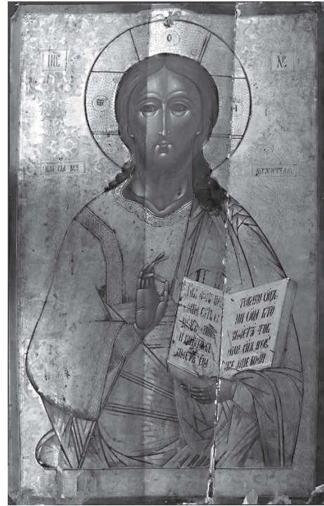
Fig. 3. Tătăraștii de Sus. Biserica „Sfântul Nicolae” – icoană împărătească „Iisus Hristos Pantocrator”.

un semicilindru 16 , la al cărei capăt estic se afla o încăpere de dimensiuni mai mari, dotată cu un horn, spațiu care ar fi putut avea funcțiunea de bucătărie.