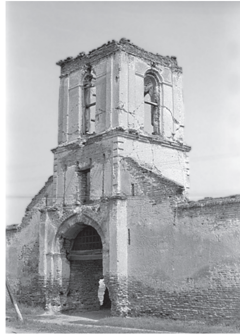
Fig. 1. Tătăraștii de Sus. Ruinele Curții din Țara Românească, cum este cel de la Bălăceanu – intrarea cu turn – clopotniță.

Gugești 12 , curtea de la Tătăraștii de Sus prezintă un ansamblu unic, ridicat după un plan încheșat, perfect axat, care integrează atât locuința și acareturile, cât și biserica și turnul – clopotniță 13 . Suprafața inclusă în cele două incinte și apărată printr-un sistem progresiv, ce începe cu poarta și se termină cu biserica, este de aproximativ 5400 m 2 , adică peste o jumătate de hectar.